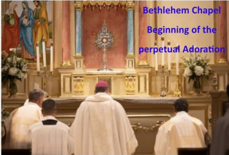
Bethlehem Chapel Beginning of the perpetual Adoration